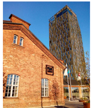
Hotelli Tornin ja veturitallien ympäristökin on rouheaa tyyliä.

fi.wikipedia.org/wiki/Hotelli_Torni_Tampere www.sokoshotels.fi/fi/tampere/solo-sokos-hotel-torni-tampere