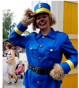
Koiravahti Koiramäen portilla Särkänniemessä.

Vierellä on Särkänniemi: huvipuisto, Koiramäki, Näsinneula-näkötorni, akvaario ja planetaario. Sisäänkäynti huvipuistoon on ilmainen, sinne voi mennä vain kiertelemään tai syömään. Huvituksista maksetaan kohde kerrallaan tai kaikki samalla rannekkeella. www.sarkanniemi.fi