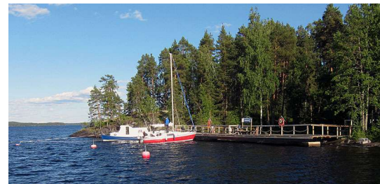
Peronsaaren pohjoispuolen laituri.

Laiturit etelä- ja pohjoispuolella. Laitureissa saattaa olla mielenkiintoinen kokoelma erilaisia veneitä pienestä purjeveneestä isoon hinaajaan. lempinen.net/peronsaari