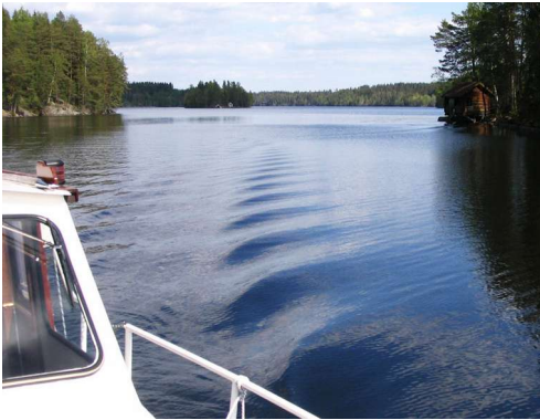
Teiskon vuonossa on sekä jylhiä kalliorantoja että idyllisiä peltomaisemia, paljon myös mökkejä.