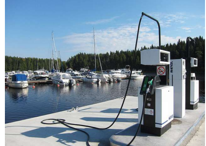
Pimeesalmen uusi tankkauslaituri.

Pimeesalmen telakka ja satama sijaitsevat suojaisassa salmessa Näsijärven länsirannalla. Polttoainemyynti. Terassilla on tarjolla juomia ja grilliruokaa. Lauantaisin elävää musiikkia ja tanssit. www.enqvistintelakka.fi