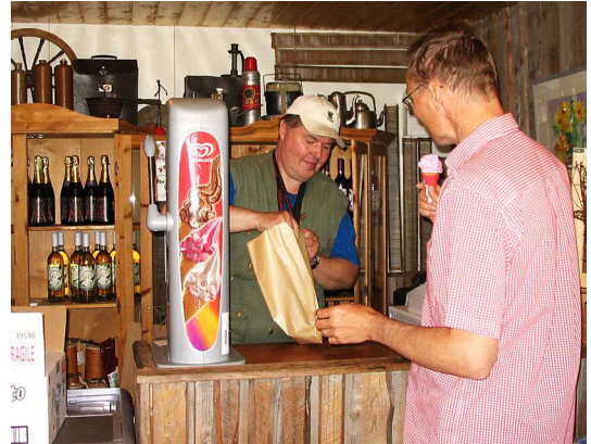
Teiskon viinitilan myymälästä on saanut myös jäätelöä.

Viinitilan erikoisuuksia ovat tomaattiviini ja tyrnikuohuviini, myös liköörejä. Juomia voi maistella paikan päällä ja ostaa mukaan. www.teiskonviini.fi