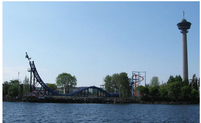
Näsinneula ja huvipuistoa vesiltä päin tultaessa.

Vierellä on Särkänniemi: huvipuisto, Koiramäki, Näsinneula-näkötorni, akvaario ja planetaario. Sisäänkäynti huvipuistoon on ilmainen, sinne voi mennä vain kiertelemään tai syömään. Huvituksista maksetaan kohde kerrallaan tai kaikki samalla rannekkeella. www.sarkanniemi.fi