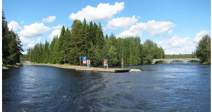
Vasemmalla Muroleen kanava, oikealla vapaana virtaava koski, keskellä odotuslaituri.

Muroleen kanavalle etelästä saavuttaessa näkyy oikealla puolella kosken yli kulkeva kolmiaukkoinen kivisilta.