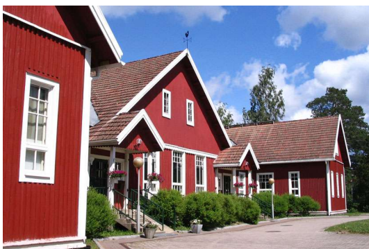
Maisa on suosittu häiden pitopaikka lauantaisin.

Maisansalon laguunissa on tyyntä, vaikka Koljonselällä kuinka keikuttaisi. Hyvä ilmainen laituri ravintolan alapuolella.